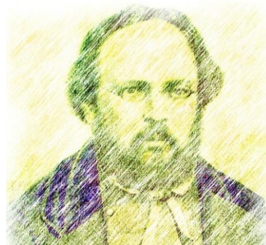
Pierre Joseph Proudhon (1809–1865) benannte das Gleichgewicht von Leistung und Gegenleistung als soziales Gesetz

Die Bezahlung des Wassersflasche ist Fürsorge für die Menschen, welche die Wasserflasche produziert haben. Die gegenseitige Beachtung der Bedürfnisse von Produzent und Konsument kann als „Brüderlichkeit“ bezeichnet werden ■